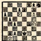
№ 6 В. И. Шиф III доска