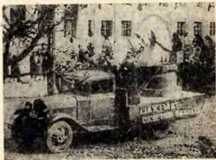
Перваяяская демонстрация шахматистов в Минске.

Таково было отношение к параду рядовых шахматистов, в основном с фабрик и заводов. Но где были мастера? Где было руководство и члены шахкомитета? Увы... их не было. Шахкомитет взял на себя всего только скромную задачу: довести до сведения ленинградских мастеров свое же постановление о необходимости участия их в физкультурном параде и, очевидно, тем самым разъяснить им политическое значение их участия в параде. Кроме того, профсоюзы разослали мастерам и I категории персональные письма с просьбой возглавить шахматный отряд. Но шахкомитет абсолютно ничего не сделал для реализации своего постановления, и шахматная колонна, идя в 100.000 физкультурной массе, могла только наблюдать цвет шахматной культуры города Ленина в роли зрителей на одной из трибун. И. Г.