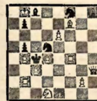
№ 13 С. Лейтес (М.) VII доска