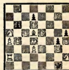
№ 12 В. Д. Кобец VI доска