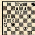
№ 10 З. М. Бирнов (М.) V доска