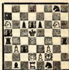
№ 4 Л. И. Куббель (Л.) II доска