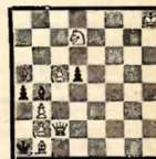
№ 16 А. Бернштейн. VIII доска